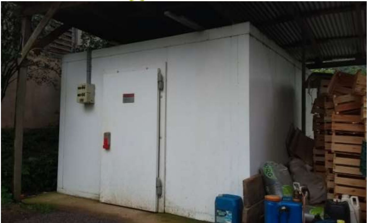
Figura 9 – Câmera fria utilizada para armazenagem do produto.