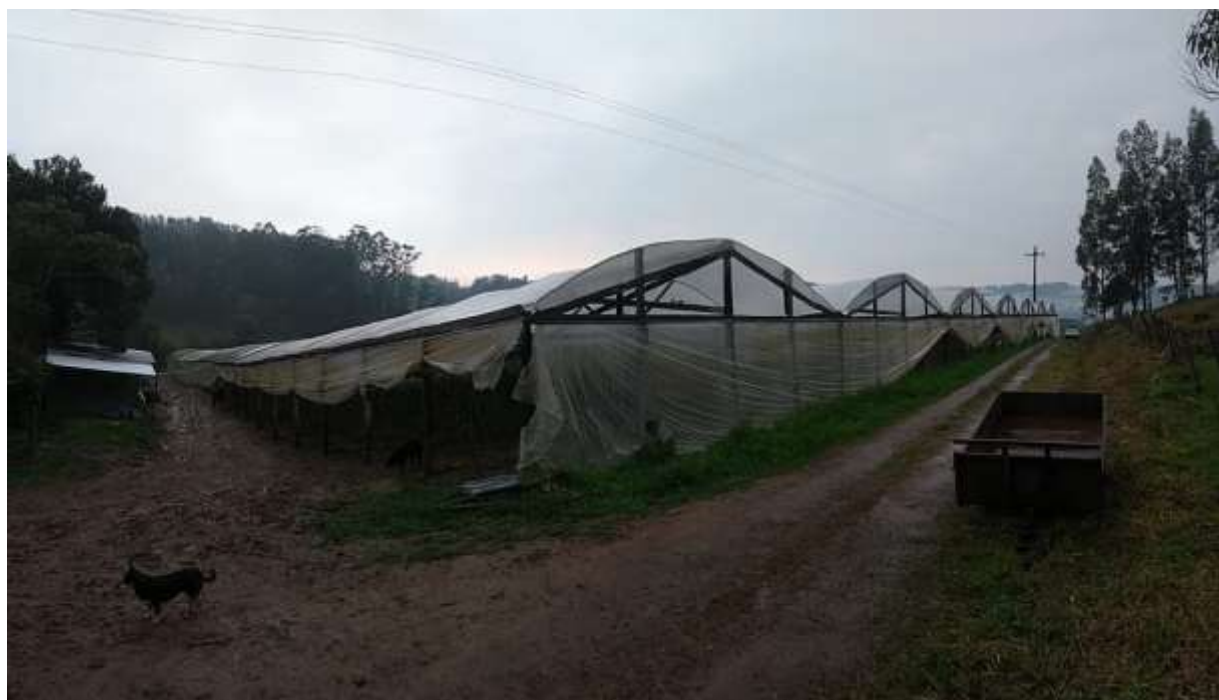
Figura 2 – Área externa da estufa.