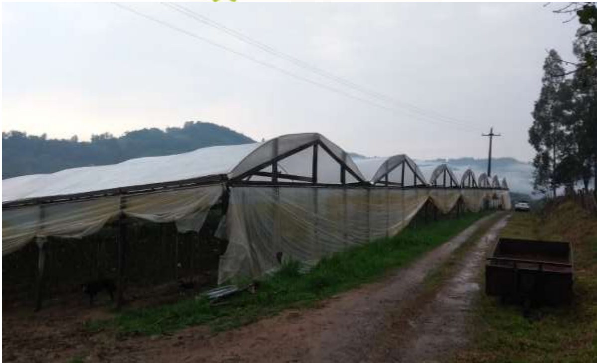
Figura 3 – Área externa frontal da estufa.