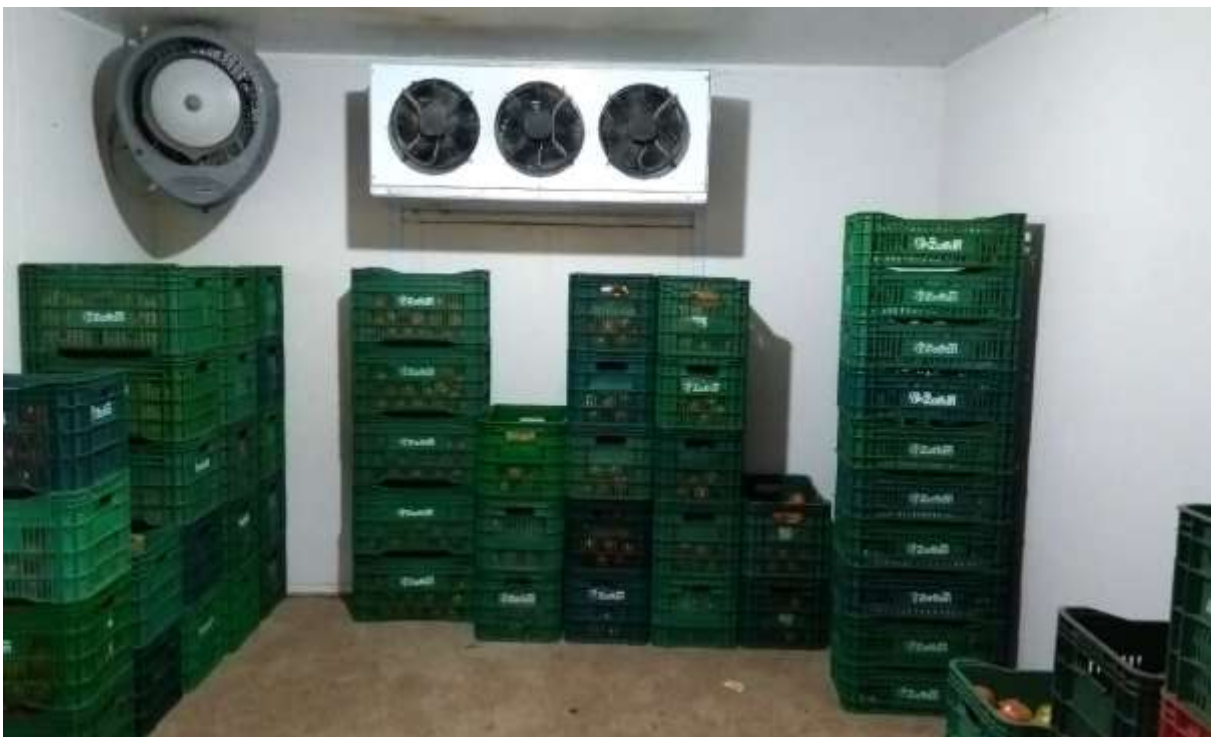
Figura 10 – Interior da câmara fria para armazenagem com caixas de tomates prontas para comercialização.