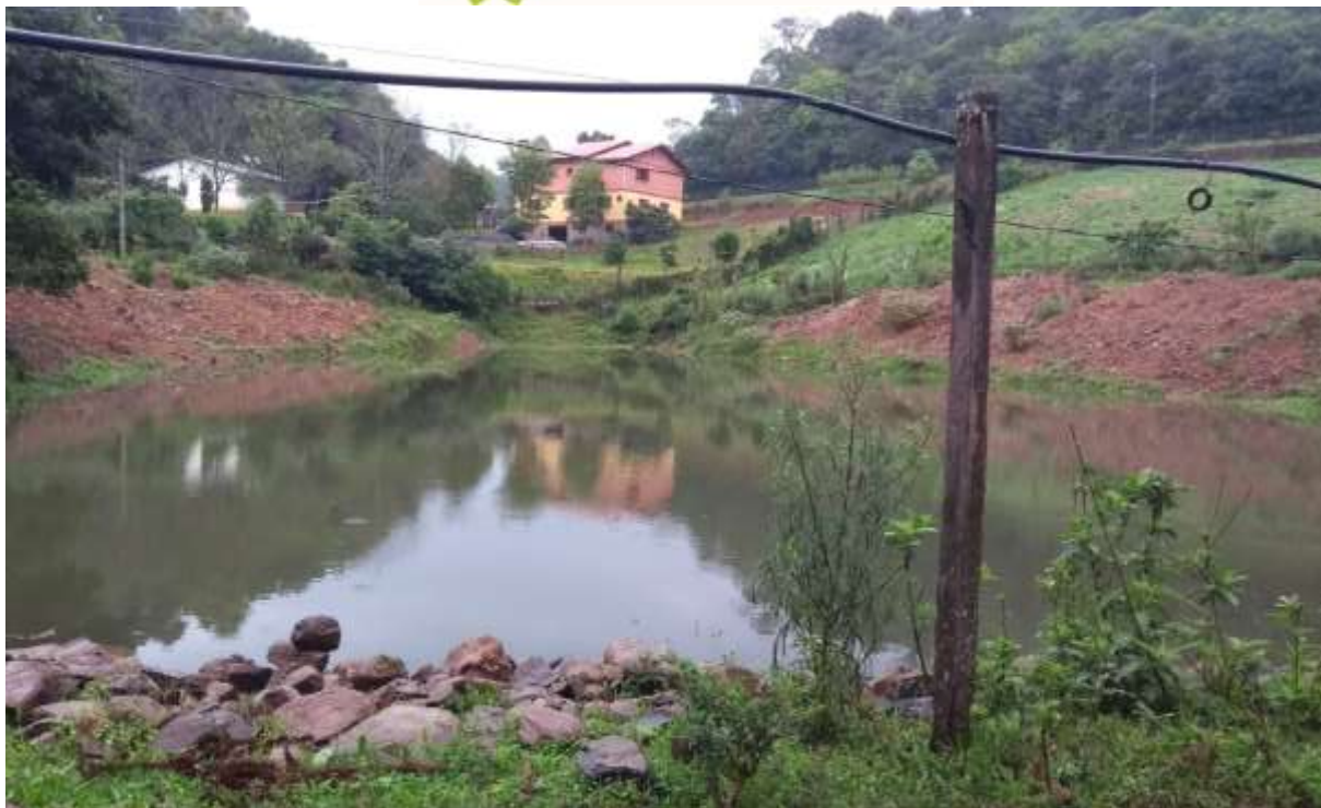
Figura 11 – Imagem de um dos quatro açudes da propriedade utilizados para irrigação.