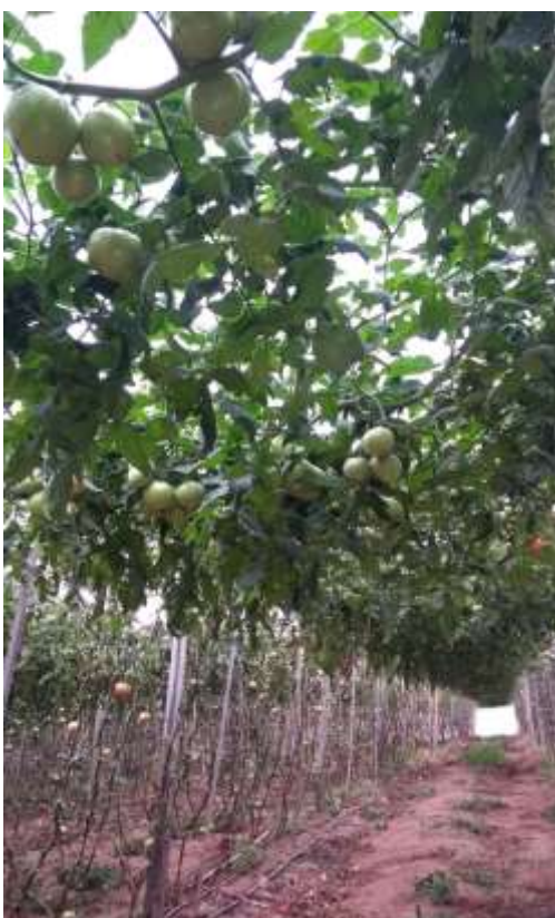
Figura 7 – Parte aérea do tomateiro.