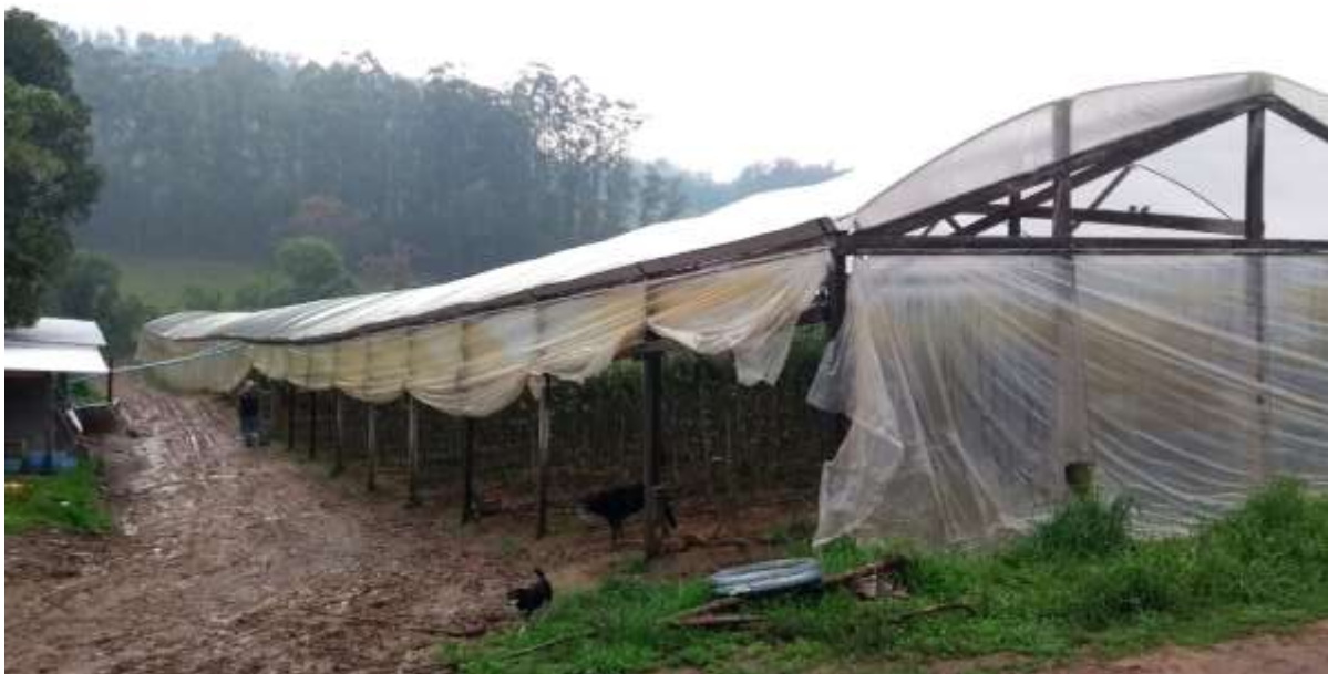
Figura 4 – Área externa lateral da estufa.