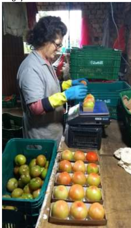
Figura 8 – Classificação dos tomates conforme tamanho.