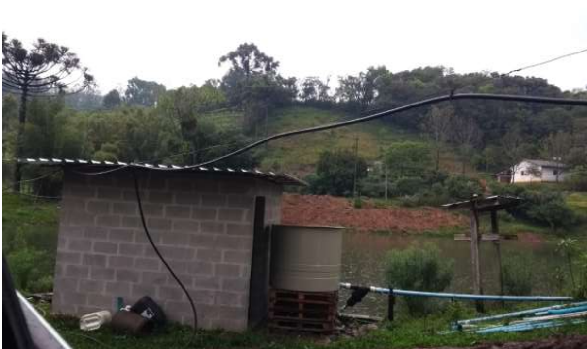
Figura 12 – Central de irrigação da propriedade ao lado do açude principal.