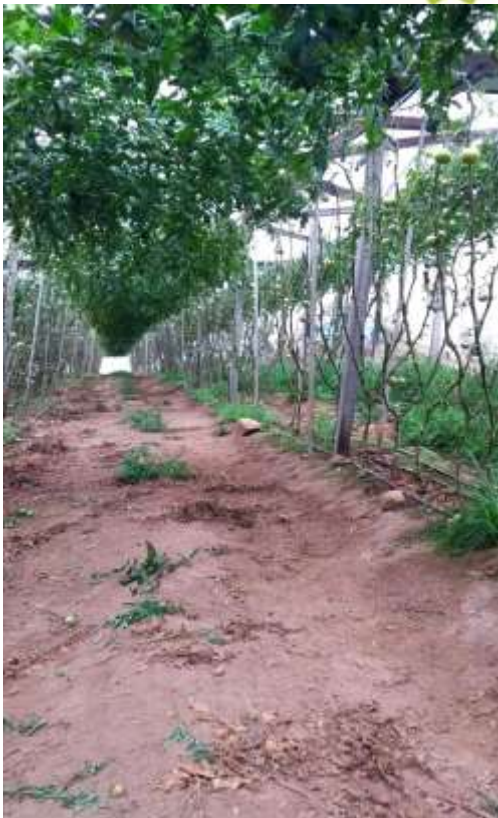
Figura 5 – Área interna da estufa.