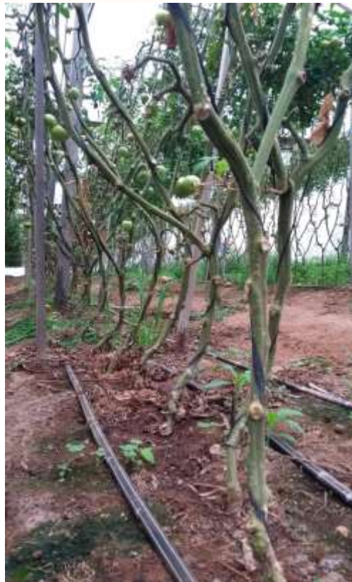
Figura 6 – Plantas de tomate e canos de irrigação.