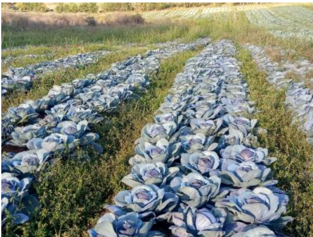
Foto 2- Lavoura de repolho roxo, pronta para ser colhida.