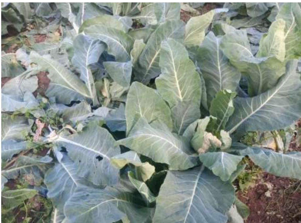
Foto 4- Lavoura de couve flor, algumas plantas já foram colhidas e outras ainda em desenvolvimento.