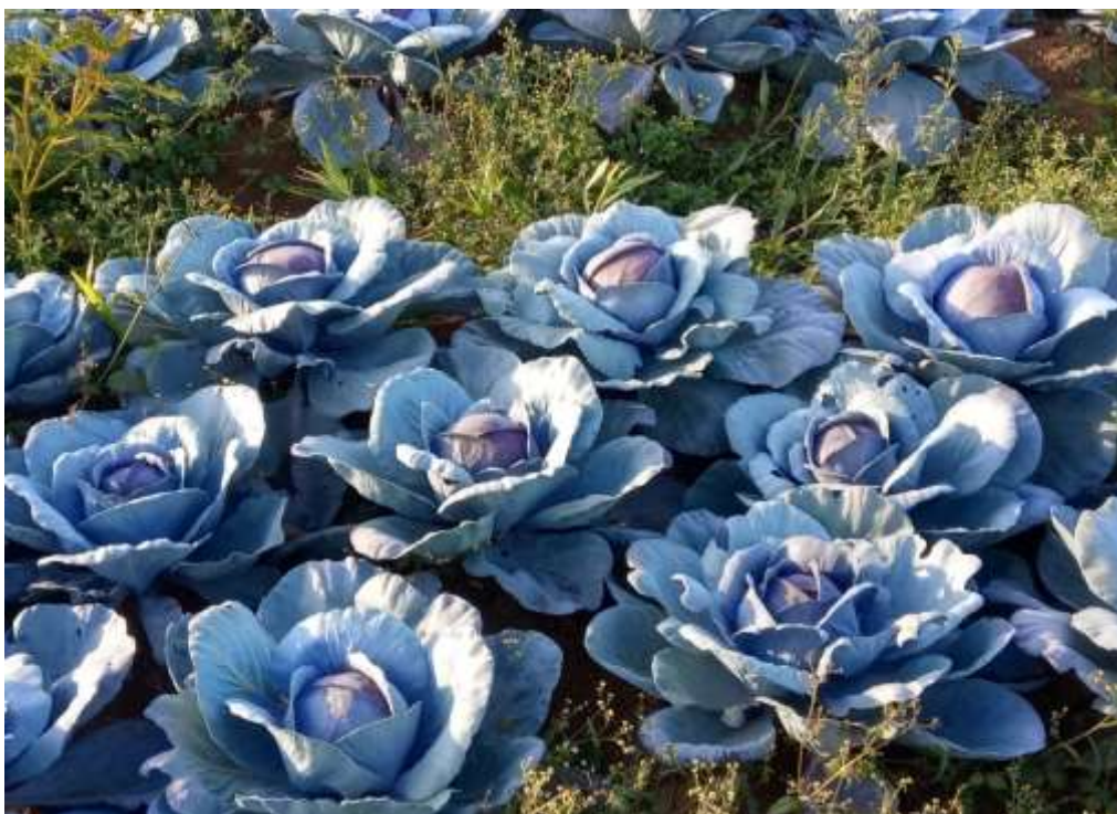
Foto 1- Lavoura de repolho roxo, pronta para ser colhida.