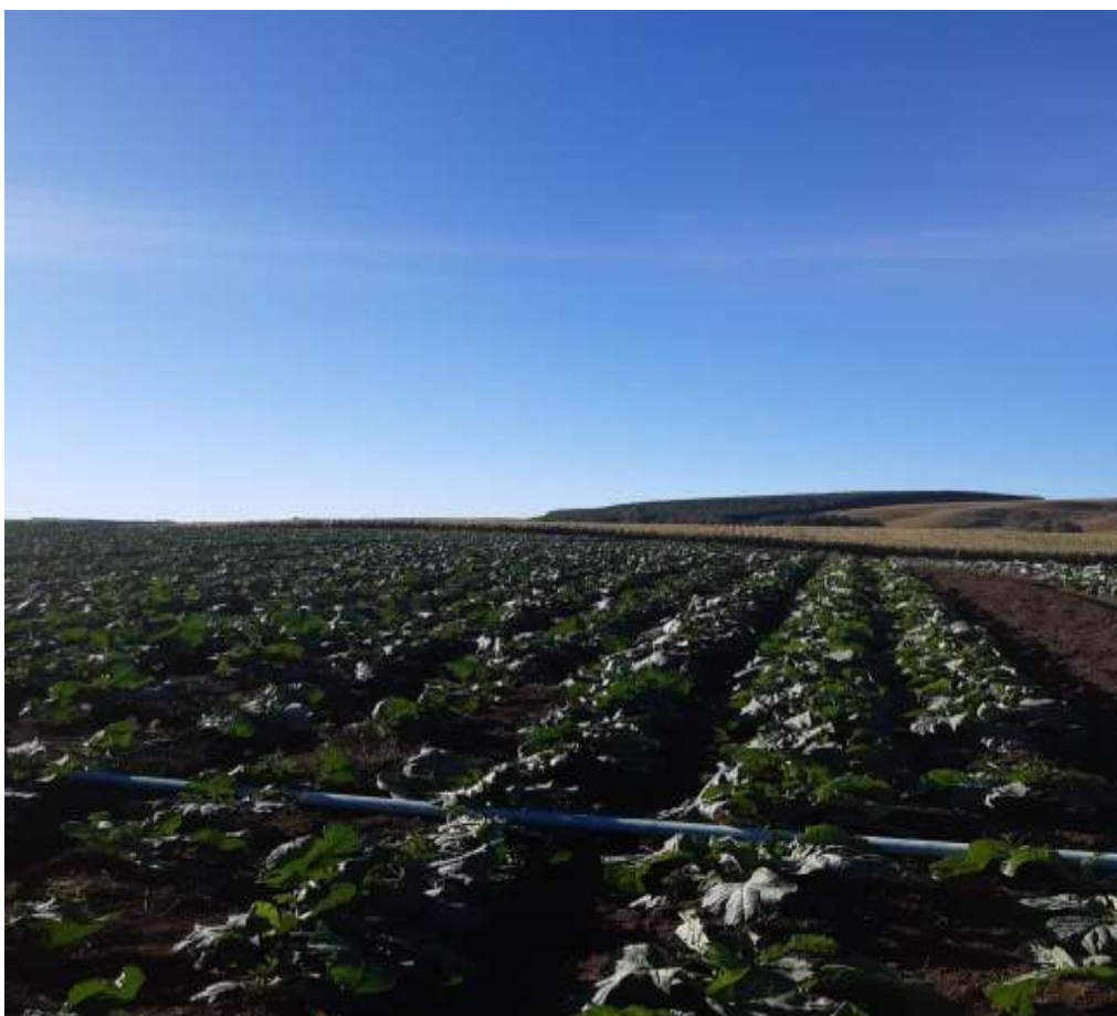
Foto 6- Lavoura de Brócolis em desenvolvimento.