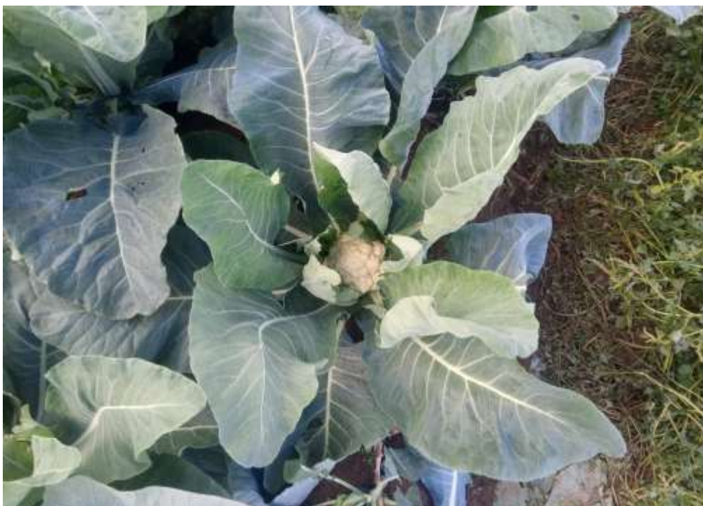
Foto 3- Lavoura de couve flor, algumas plantas já foram colhidas e outras ainda em desenvolvimento.