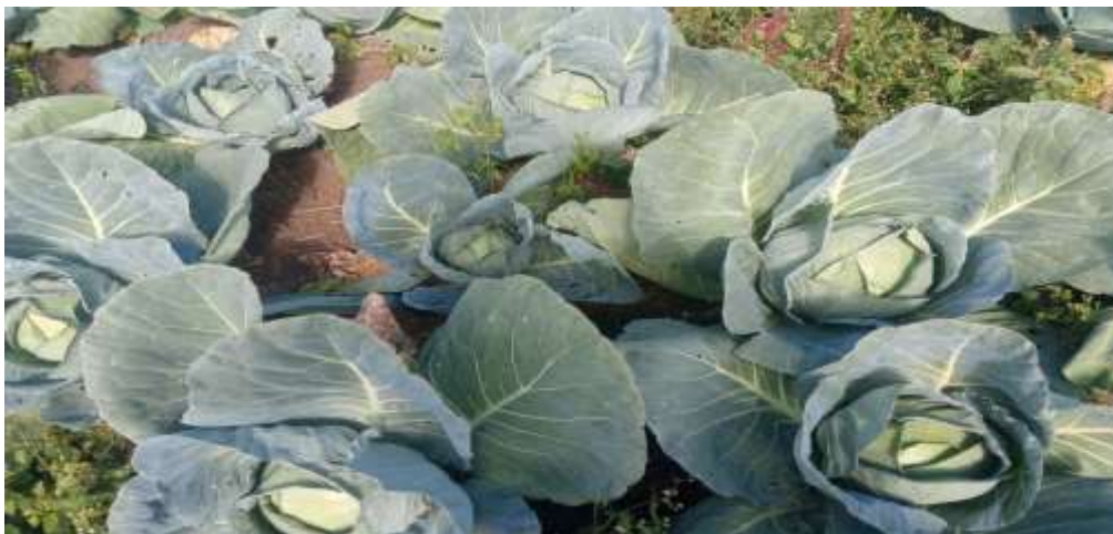
Foto 5- Lavoura de repolho verde pronta para ser colhida.