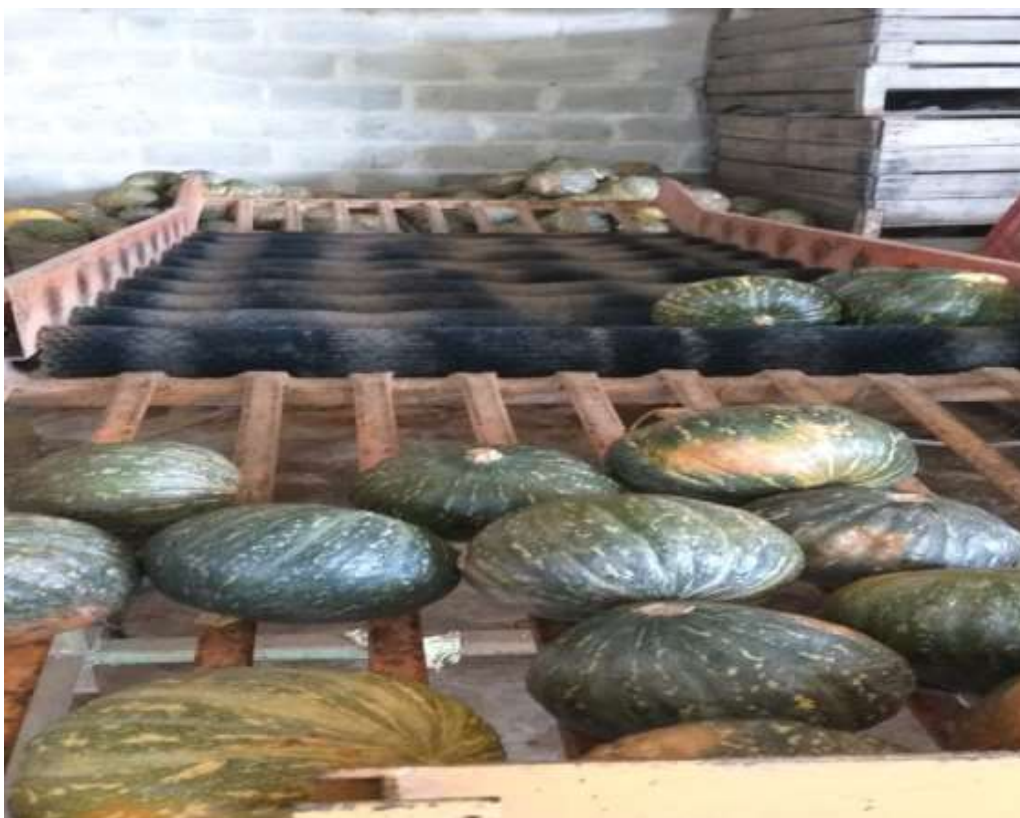
Foto 9- Máquina de escovar abóbora cabotiá.