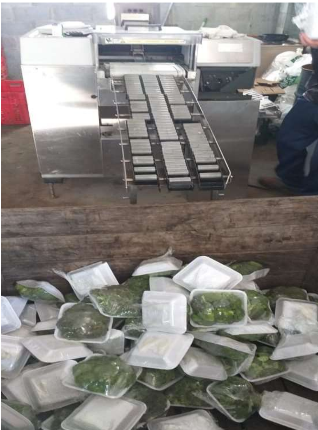
Foto 7- Máquina de embalar em funcionamento, no momento da visita o produtor estava embalando brócolis.