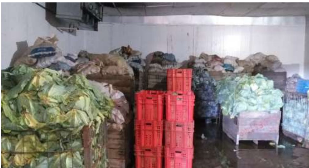
Foto 8- Mercadoria armazenada na câmara fria depois de ser colhida.