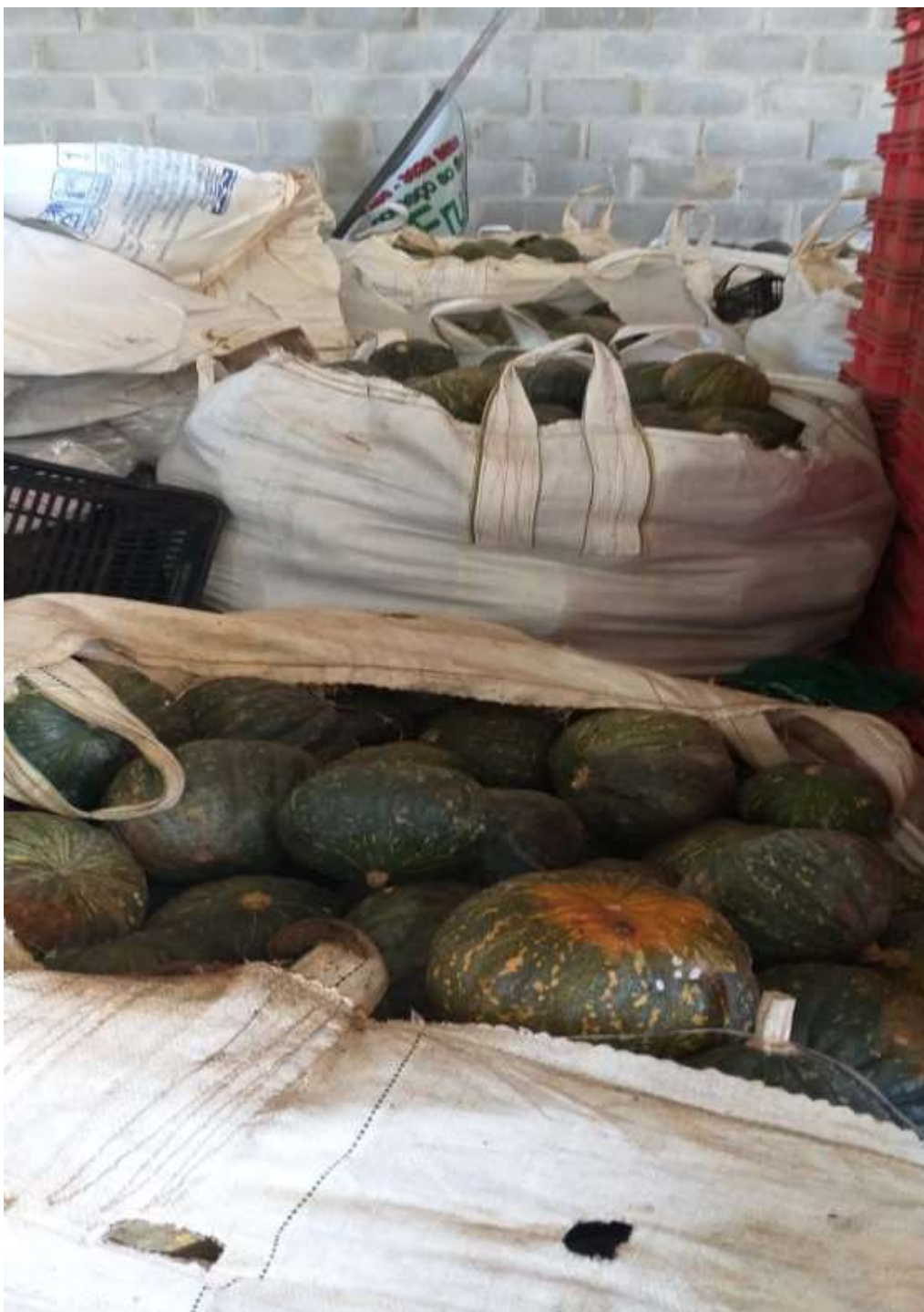
Foto 10- Abóbora Cabotiá armazenada para ser vendida durante o ano.